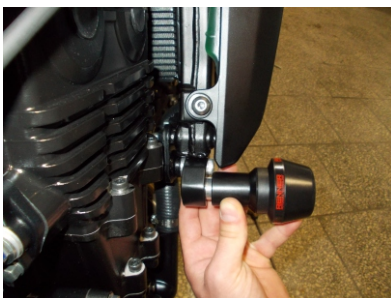
Assembly position (right side)