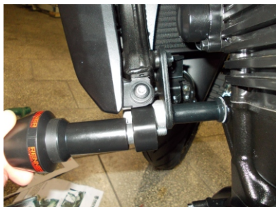
Assembly position (left side)