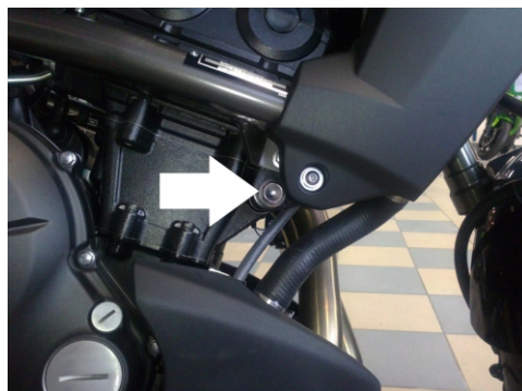
Miejsce mocowania (strona prawa)