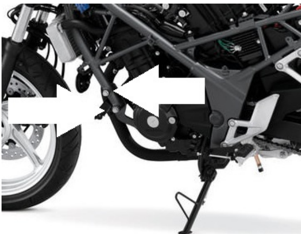
Miejsce montażu (obie strony)