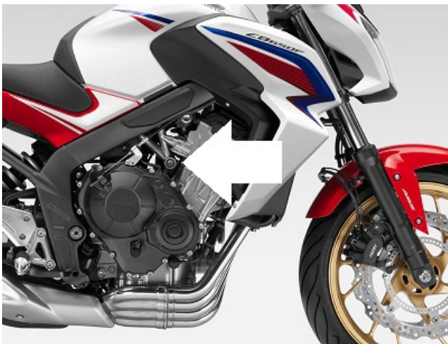
Miejsce montażu (obie strony)