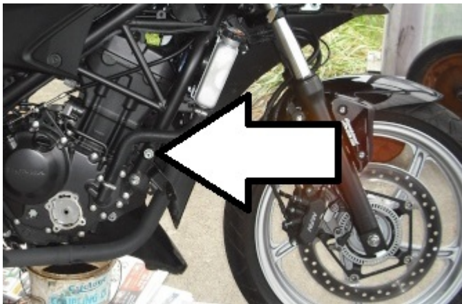
Miejsce montażu (obie strony)