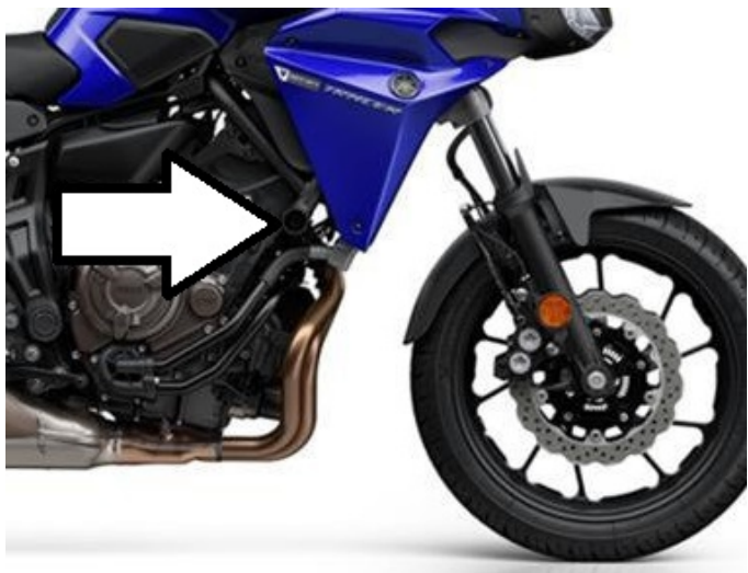
Miejsce montażu (obie strony)