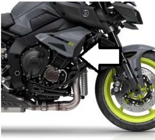
Miejsce montażu (obie strony)