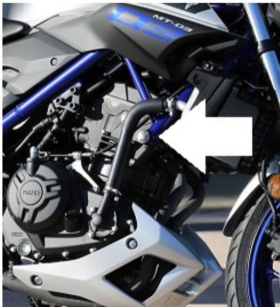
Miejsce montażu (obie strony)