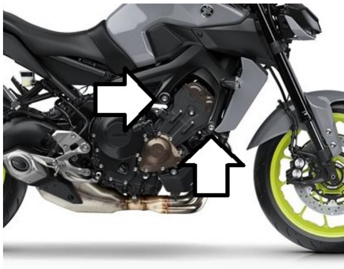
Miejsce montażu (obie strony)