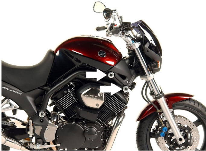
Miejsce montażu (obie strony)